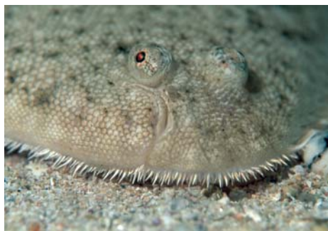
Figure 6 La sole , comme tous les poissons plats, s'enfouit dans le sable et chasse à l'affût de petites proies. Cavalaire, © Yann Lefranc.