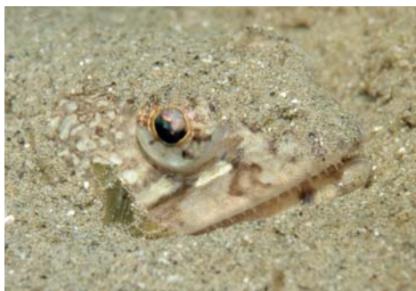
Figure 5 La vive chasse à l'affût de petits poissons. Ses yeux très hauts sur le crâne, sa bouche quasi verticale sont la conséquence de son adaptation à l'enfouissement. Cavalaire, © Yann Lefranc.

Certains animaux s'enracinent véritablement dans le sable. Seuls dépassent les tentacules de certaines anémones, ou le panache des branchies