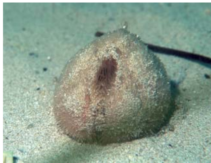
Figure 4 L'oursin des sables vit enfoui sous 10 cm de sable. Son terrier communique avec la surface par une cheminée, dont l'orifice évasé trahit la présence au plongeur naturaliste averti. Île Saint-Nicolas-Les Glénan, © Yann Lefranc.