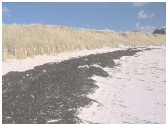
Figure 7 Les algues rejetées par la marée sont dégradées par une foule d'animaux détritovores comme les puces de sable. Les plantes comme les oyats forment des brise-vents et stabilisent la dune grâce au réseau dense de leurs racines. Une clôture protège ici les oyats du piétinement. Jersey, © Yann Lefranc.

de certains vers. D'autres animaux enfouis conservent en permanence un contact avec l'eau libre, source d'oxygène et de nourriture. Les coquillages comme les coques, vénéus ou couteaux développent deux tuyaux, les siphons, qui permettent d'aspirer et de refouler l'eau. Les trous et les dépressions dans le sable à marée basse révèlent leur présence au pêcheur à pied. La capacité de certains coquillages à se refermer hermétiquement au moment de la marée basse leur permet de s'installer haut sur la plage. En revanche, ceux qui, comme le couteau, possèdent des siphons si gros qu'ils ne peuvent rentrer dans la coquille, ne se trouvent qu'en bas de la plage, à la limite des flots de la basse mer.